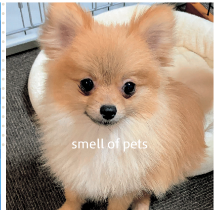
smell of pets